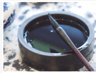
2500 a. C.: pincel y tinta.