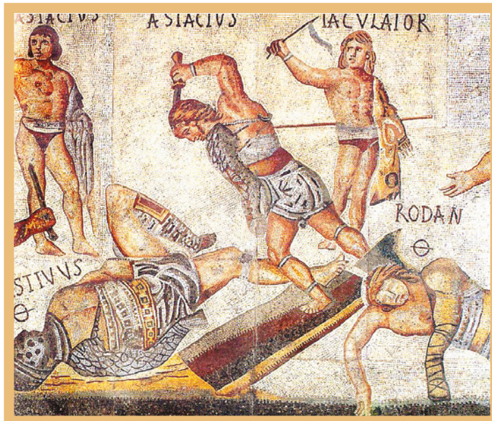
Gladiadores romanos representados en un mosaico.

Espartaco lideró una revuelta que reunió a decenas de miles de esclavos de Italia, que se le unieron con la intención de escapar de su miserable condición. El gobierno de Roma debió recurrir a la movilización de las legiones para controlar la situación.