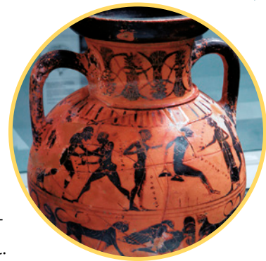
Los griegos decoraban con gran originalidad vasijas, ánforas y platos.

Más tarde, en el período helenístico, las formas escultóricas fueron perfeccionándose y agrandándose, y llegaron a considerarse un arte monumental, estrechamente unido a la arquitectura.