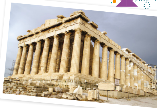
El Partenón, el templo más importante de Atenas.

Para el período clásico, en los siglos V y IV a. C., la arquitectura griega llegó a su máximo apogeo. Allí surgió el orden corintio, con formas más estilizadas y columnas que terminaban imitando hojas de acanto.