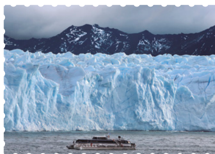
Glaciar Perito Moreno, provincia de Santa Cruz.