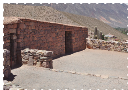
Pucará de Tilcara, provincia de Jujuy.