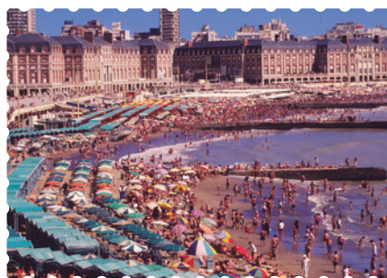
Mar del Plata, provincia de Buenos Aires.