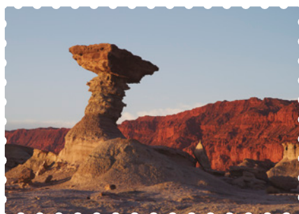
Valle de la Luna, provincia de San Juan.