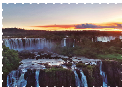
Cataratas del Iguazú, provincia de Misiones.

En la Argentina existe una gran variedad de paisajes. Hay regiones cálidas, muy frías, con mucho viento, secas o húmedas. Se encuentran lugares con altas montañas, ciudades a orillas del mar, extensas regiones desérticas, bosques, campos cultivados, zonas con lagos y ríos. Nuestro país es muy grande y se lo puede recorrer en auto, en ómnibus, en tren o viajando en avión. Conozcan algunos de estos hermosos lugares.