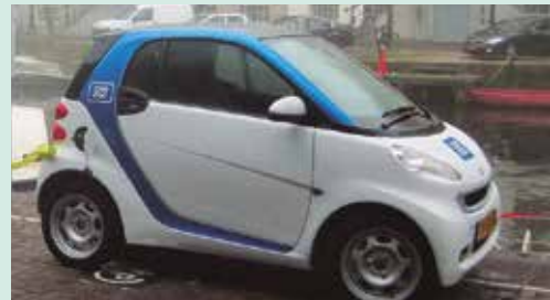
Ejemplar del primer auto eléctrico argentino.

Desde fines del año 2016, nuestro país tiene el primer vehículo eléctrico urbano y el primero en Sudamérica. Este automóvil está inspirado en un modelo italiano. Posee cuatro baterías que tardan en cargarse 5 horas y puede recorrer distancias de 65 kilómetros sin necesidad de recargarlas. Este auto eléctrico es amigable con el planeta.