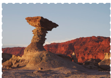
Valle de la Luna, provincia de San Juan.