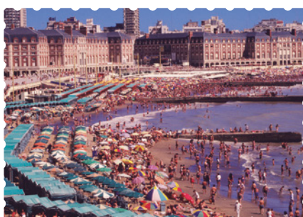
Mar del Plata, provincia de Buenos Aires.