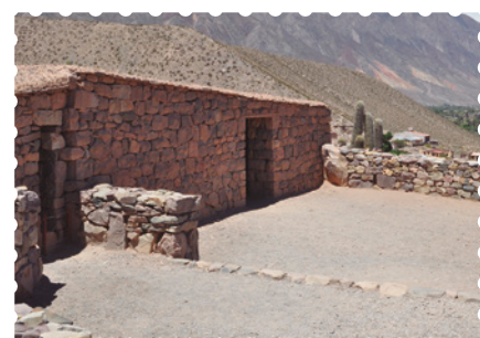
Pucará de Tilcara, provincia de Jujuy.