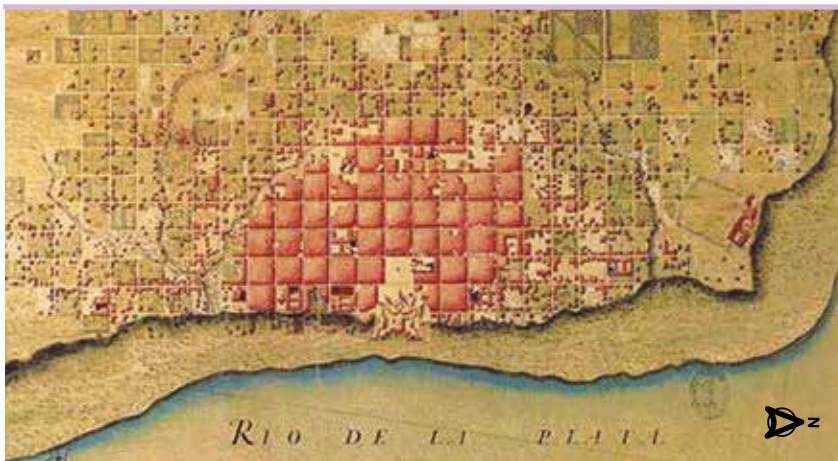
La ciudad de Buenos Aires en 1750

Los científicos sociales (como los historiadores, sociólogos y geógrafos, entre otros) son investigadores que trabajan con diferentes tipos de fuentes, con el fin de reconstruir hechos pasados y presentes, para comprenderlos, interpretarlos y contextualizarlos. La propuesta en este caso es trabajar con planos.