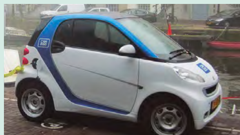
Ejemplar del primer auto eléctrico argentino.

Desde fines del año 2016, nuestro país tiene el primer vehículo eléctrico urbano y el primero en Sudamérica. Este automóvil está inspirado en un modelo italiano. Posee cuatro baterías que tardan en cargarse 5 horas y puede recorrer distancias de 65 kilómetros sin necesidad de recargarlas. Este auto eléctrico es amigable con el planeta.