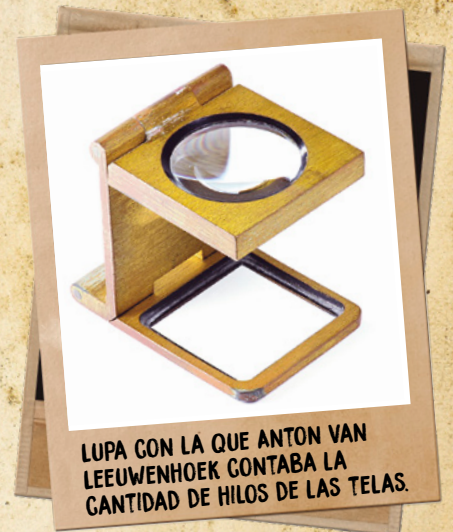
LUPA CON LA QUE ANTON VAN LEEUWENHOEK CONTABA LA CANTIDAD DE HILOS DE LAS TELAS.

Anton van Leeuwenhoek, Carta N.º 18 , Royal Society de Londres, Londres, 1677. (Adaptación).