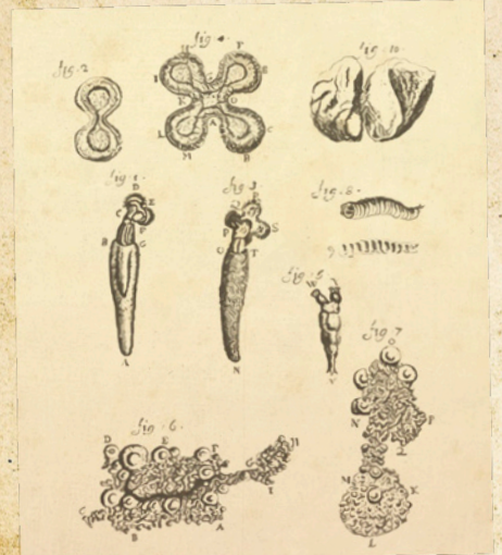
Otros dibujos de Anton van Leeuwenhoek, al mirar por su microscopio agua de una laguna.