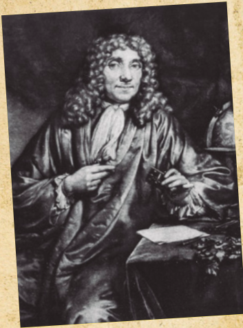
Anton van Leeuwenhoek.

Una vez utilizó su lupa para observar el agua y quedó fascinado. ¡Algo había allí que se movía! Entonces, decidió dibujar y relatar lo que observaba y este material se publicó en una revista importante de ciencia de aquella época.