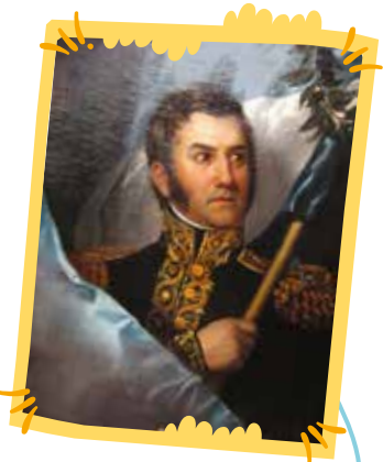
Retrato de José de San Martín.

El primer enfrentamiento del Regimiento de Granaderos a Caballo con los españoles fue el combate de San Lorenzo, ocurrido en 1813.